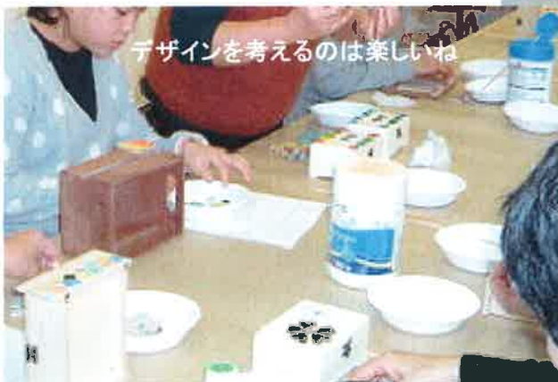
デザインを考えるのは楽しいね