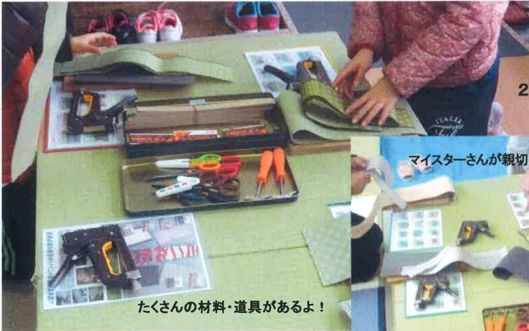
たくさんの材料・道具があるよ！