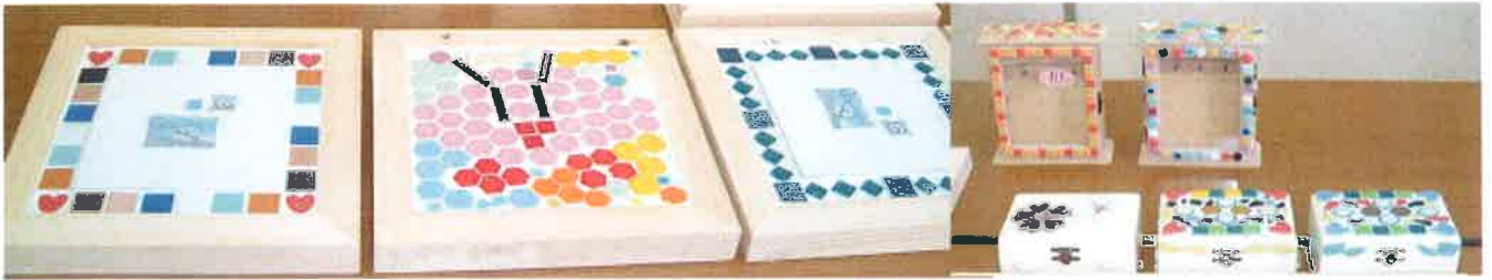
うえきばちおき だい なべし かざ = 植木鉢置き台、鍋敷き、飾りフレームの例 =