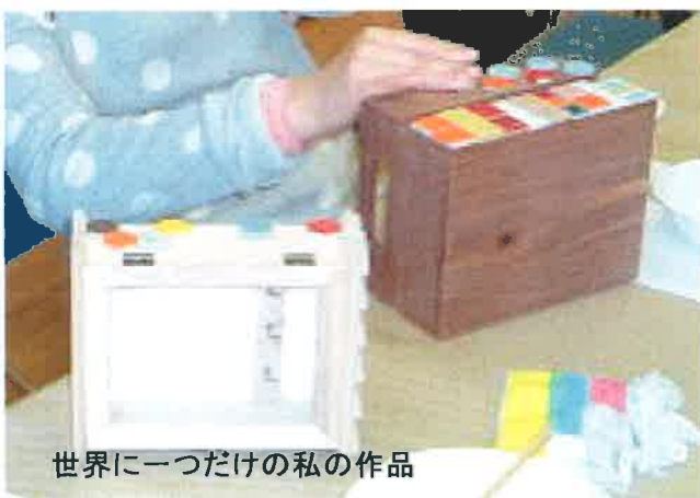
世界に一つだけの私の作品