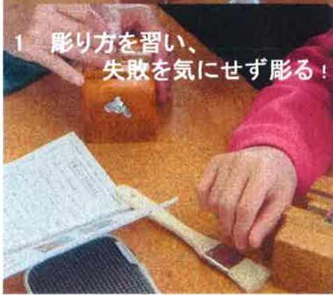
1 彫り方を習い、 失敗を気にせず彫る！