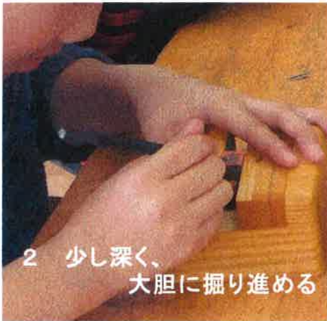
2 少し深く、 大胆に掘り進める