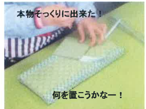
本物そっくりに出来た！