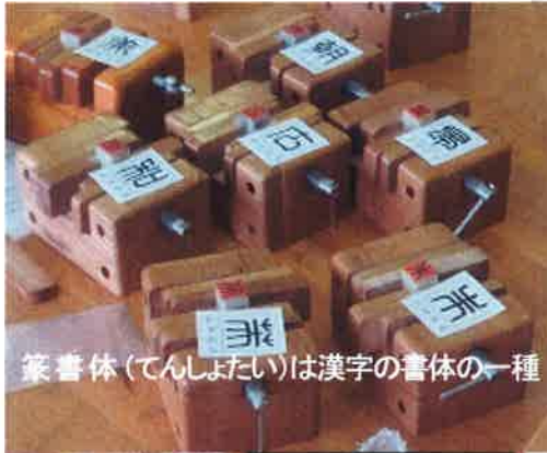
篆書体(てんしよたい)は漢字の書体の一種