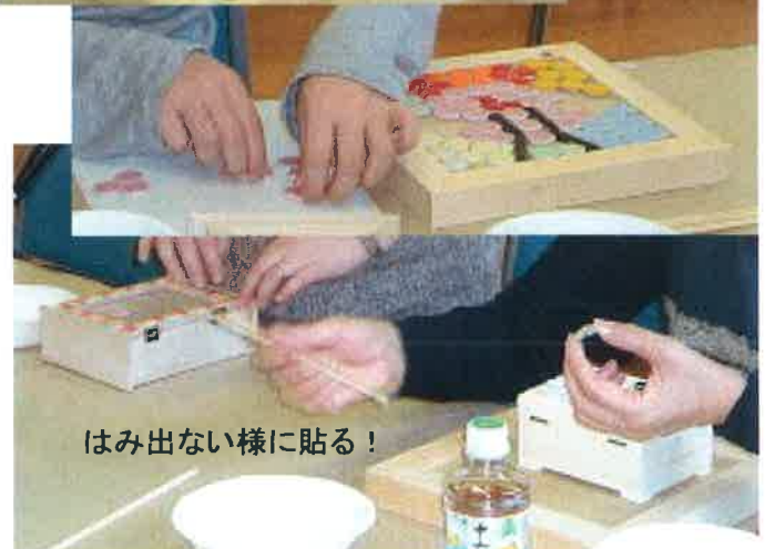
はみ出ない様に貼る!