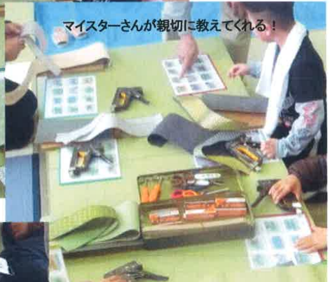
マイスターさんが親切に教えてくれる！